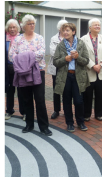
Im Garten der Religionen bei IN VIA Köln

Der dritte Tag begann mit einer sehr informativen Führung durch den Kölner Dom. Ergänzt wurde die Führung durch eine Multivisionsschau im Domforum, die sich vor allem mit den baulichen Gegebenheiten des Doms und ihrer religiösen Bedeutung beschäftigte.