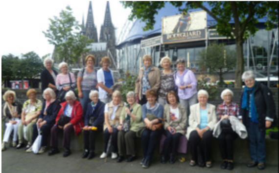
Gruppenfoto der Teilnehmerinnen am IN VIA Treffen 2016